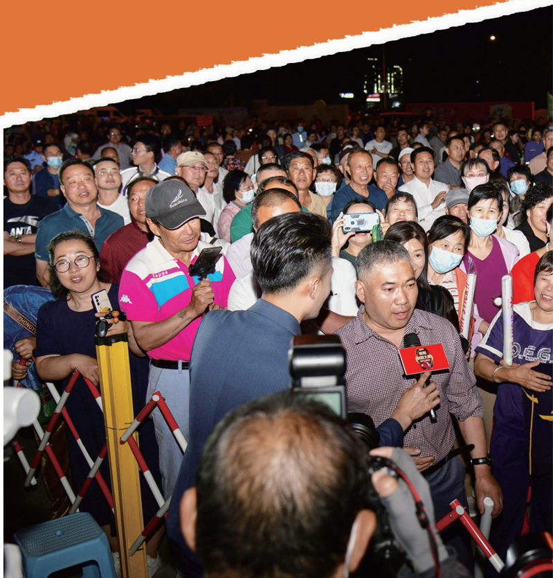
莱阳村歌大赛现场