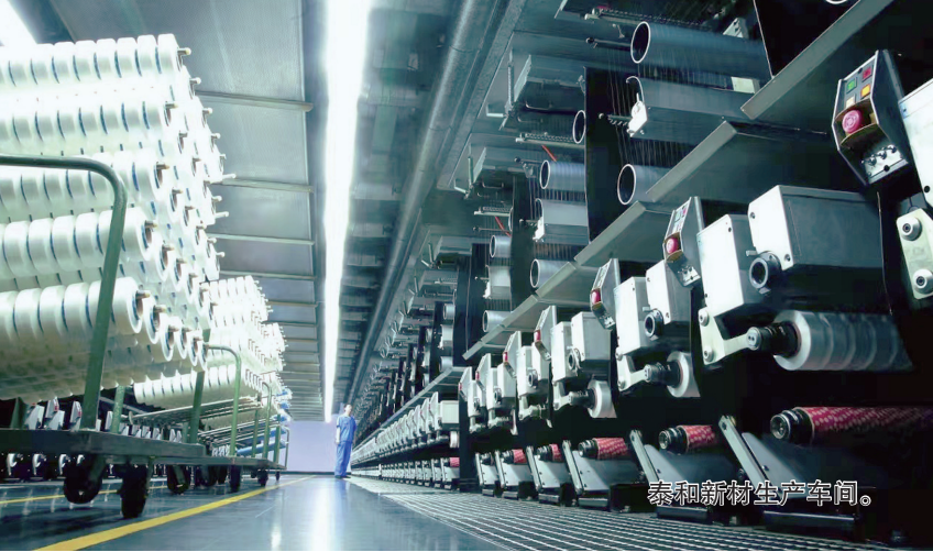
泰和新材生产车间。