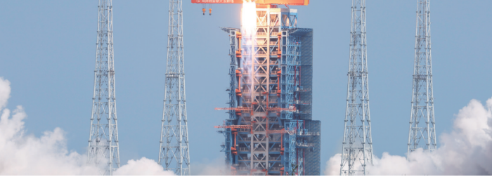
7月30日15时49分，我国在海南商业航天发射场使用长征八号甲运载火箭，成功将卫星互联网低轨06组卫星发射升空，卫星顺利进入预定轨道，发射任务获得圆满成功。 新华社

《贵金属和宝石从业机构反洗钱和反恐怖融资管理办法》8月1日起施行。办法提出，从业机构开展人民币10万元以上(含10万元)或者等值外币现金交易的，应当根据本办法规定履行反洗钱义务。客户单笔或者日累计金额人民币10万元以上(含10万元)或者等值外币现金交易的，从业机构应当按照规定在交易发生之日起5个工作日内向中国反洗钱监测分析中心提交大额交易报告。 进一步规范金融业网络安全事件报告管理 《中国人民银行业务领域网络安全事件报告管理办法》8月1日起施行。办法明确了金融从业机构在我国境内发生网络安全事件时，应当按照办法规定向中国人民银行或者住所地中国人民银行分支机构报告；明确了特别重大、重大、较大、一般等级网络安全事件的分级标准底线规则等。 新华社北京7月30日电