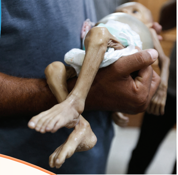
7月26日，在加沙地带南部汗尤尼斯，一名男子抱着一名因营养不良死亡了的婴儿。