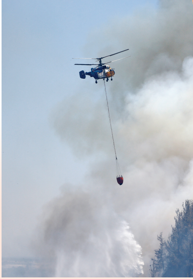
7月25日，在土耳其安塔利亚，消防直升机进行灭火作业。近日，土耳其安塔利亚部分地区遭野火侵袭。