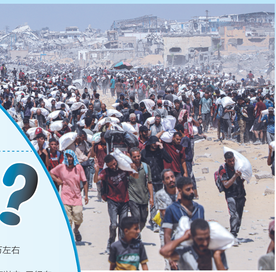
7月27日，在加沙地带北部城镇拜特拉希亚，人们领取通过边境口岸进入加沙的援助物资。