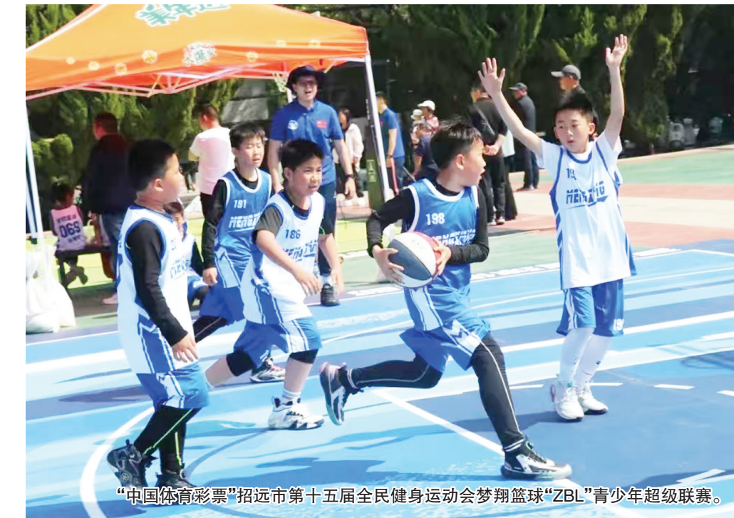
“中国体育彩票”招远市第十五届全民健身运动会梦翔篮球“ZBL”青少年超级联赛。