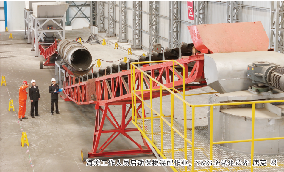
海关工作人员启动保税混配作业。

近年来,烟台市制定了“以港兴市”战略发展规划,提出依托港口资源打造“全球矿产品保税混配中心”目标,在海关总署的大力支持下,烟台先后开展了混铁、混油、混铜业