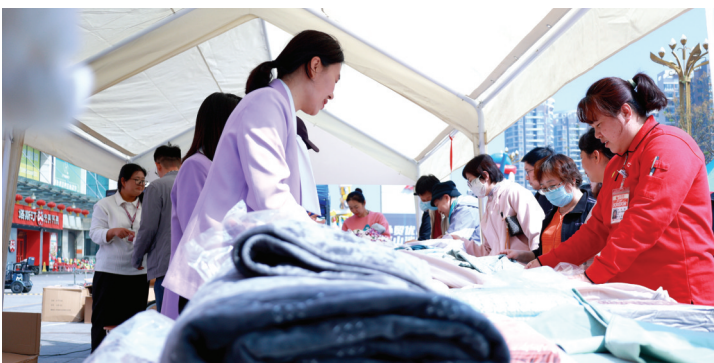
外贸优品受到消费者喜爱。

下一步,福山区将持续发力,继续搭建活动平台、促进供需对接,推动更多优质外贸企业和商品融入国内消费循环,构建消费升级与外贸企业转型升级相互促进的良性循环,为经济发展注入新动力。