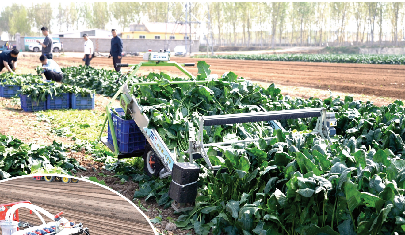
蔬菜收获机正在采收菠菜。

其实,放眼全国,这也是蔬菜行业面临的普遍问题。孙周平说,从全国调研的数据可以看出,目前国内蔬菜的人工