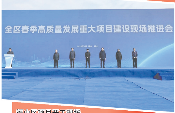
福山区项目开工现场