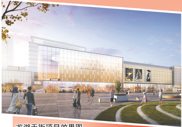
龙湖天街项目效果图

下一步,牟平区将以此次项目集中开工活动为契机,把经济发力点聚焦到项目建设上来,坚持新上项目抓开工、在建项目抓进度、竣工项目抓投产,力争省市重点项目上半年开工复工率达到100%,加快形成更多工程量、实物量、投资量,支撑实现规上工业总产值、黄金及贵重金属深加工产业“两个千亿”目标,为烟台打造绿色低碳高质量发展示范城市贡献更大牟平力量!