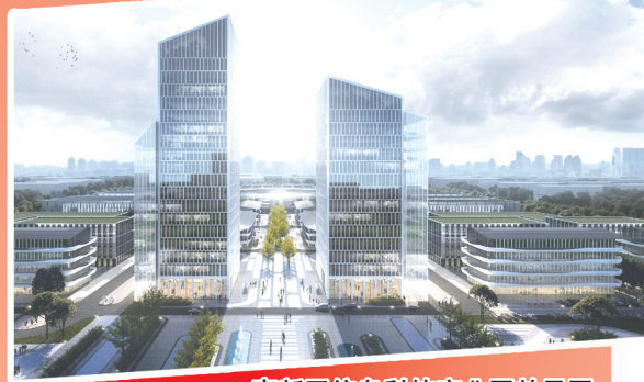
高新区信息科技产业园效果图

芝罘区将紧扣“城市更新、产业升级”主线,压茬实施重点项目“百日攻坚”行动,加快推进烟台港国际航运中心、烟台洲际酒店、烟台啤酒厂、红金台文创园、中创新媒体产业园、幸福新城数字经济产业园、双碳科创岛等省市重点项目建设,以高质量项目建设推动“突破芝罘”高质量发展。