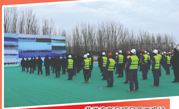
黄渤海新区项目开工现场

走在前、挑大梁、做贡献。烟台黄渤海新区将深入贯彻落实此次会议精神,按照年初抓开工、年中促进度、年底看投产,全面掀起项目建设新热潮。全力以赴抓开工,推动京东方高端显示材料、烟台港西港区泊位工程等32个新建产业项目早开工、早投产,确保省市重点项目一季度开工率在75%以上、上半年全部复工。集中力量快推进,加快推进力华储能基地、清科嘉高端装备产业园等74个续建产业项目,确保省市重点项目投资完成率一季度达到30%、上半年达到60%以上,全年固定资产投资突破700亿元。强化保障促投产,推动万华乙烯二期、汉高鲲鹏工厂等31个产业项目上半年竣工投产,确保全年投产的产业项目在40个以上,新增产值400亿元,为烟台更好发挥“三核引领”贡献更大新区力量。