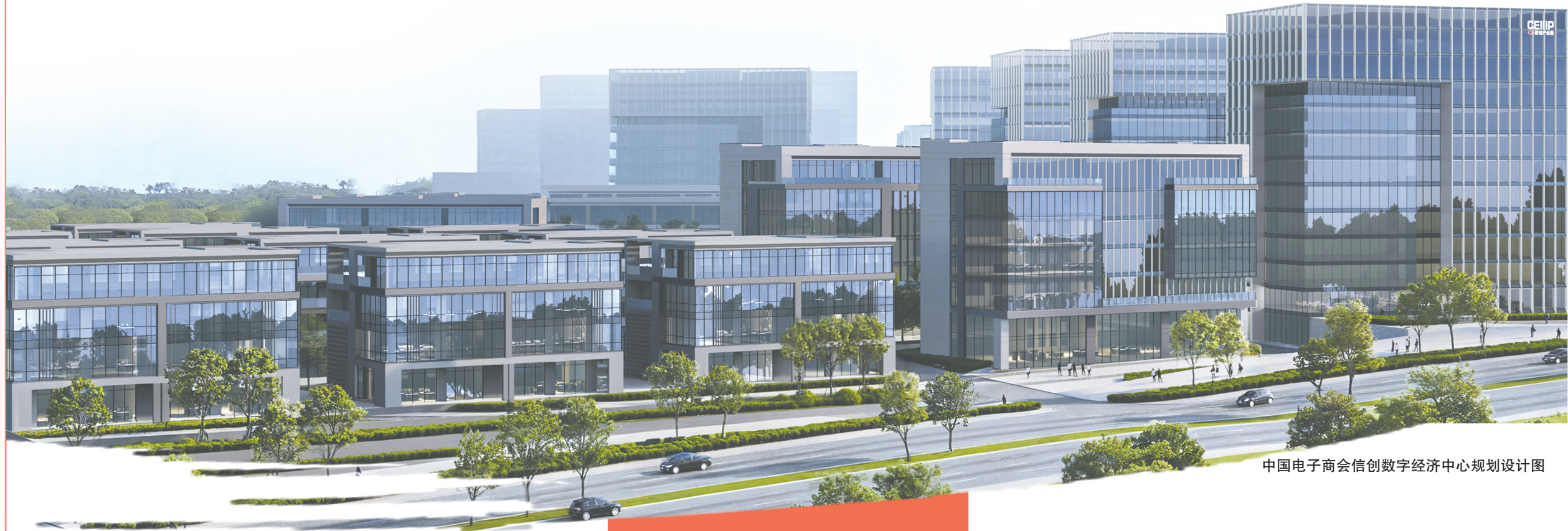
中国电子商会信创数字经济中心规划设计图