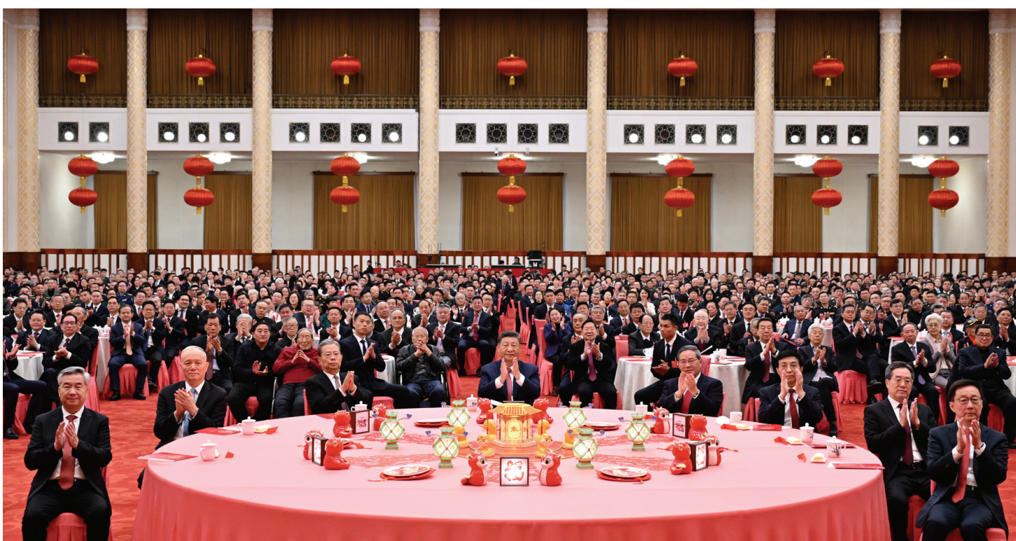
1月27日，中共中央、国务院在北京人民大会堂举行2025年春节团拜会。党和国家领导人习近平、李强、赵乐际、王沪宁、蔡奇、丁薛祥、李希、韩正等同首都各界人士欢聚一堂、共迎佳节。