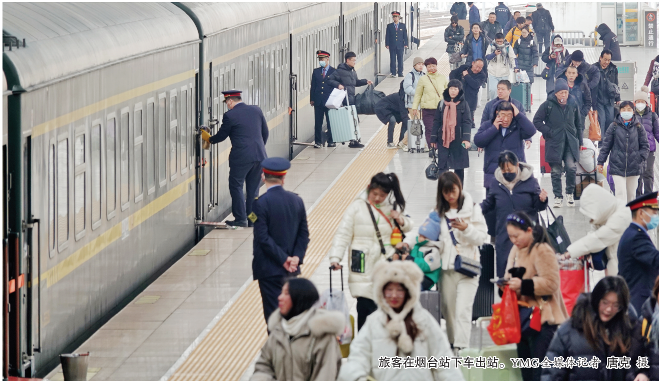
旅客在烟台站下车出站。

文艺节目热闹开场,歌曲串烧《奔跑》《你的微笑》为旅客送上旅途的多彩,陶笛演奏《故乡的原风景》与旅客们归家的心产生强烈共鸣,舞蹈《相亲相爱》将在场人的心凝聚在一起。悠扬的歌声、欢快的舞蹈点燃了现场所有人的热情,让候车