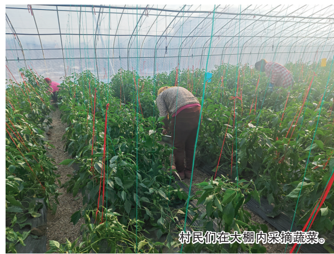
村民们在大棚内采摘蔬菜。

买点儿新鲜的水果,后铺的草莓红得透、香味浓、显喜庆,不管是自己吃还是送人都有面儿。”