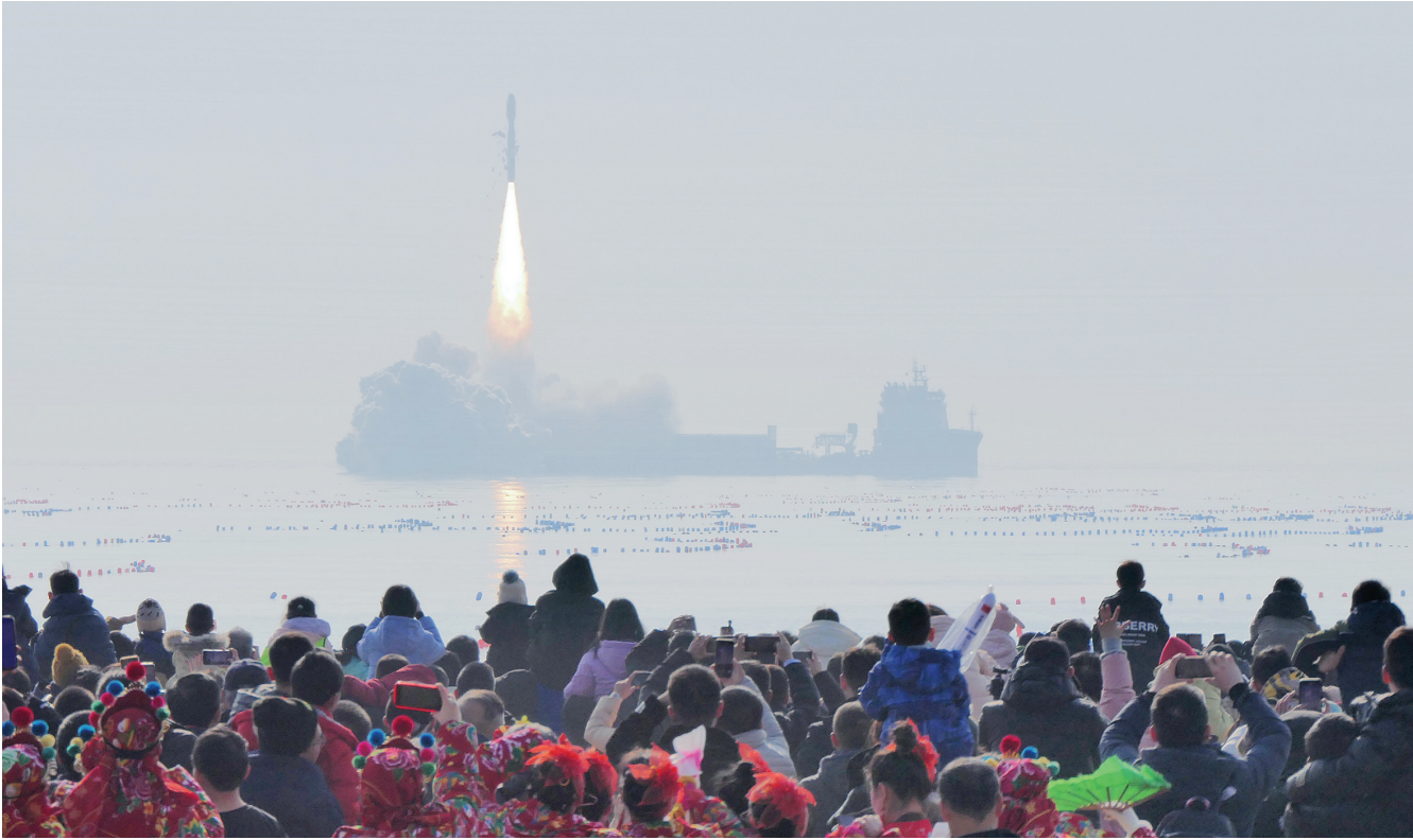
观众在海阳海滨观看捷龙三号运载火箭发射升空。

即日起，烟台日报推出“新春走基层”专栏，设“探访新质生产力”“我在工程一线”“山乡新画卷”“致敬奋斗者”“消费市场看信心”“温暖回家路”六个子栏目，多路记者深入生产生活一线，捕捉温暖人心的精彩瞬间，记录时代发展的蓬勃脉动，讲述拼搏奋斗的烟台故事，生动呈现活力满满、热辣滚烫的发展新图景、生活新风貌。敬请关注。