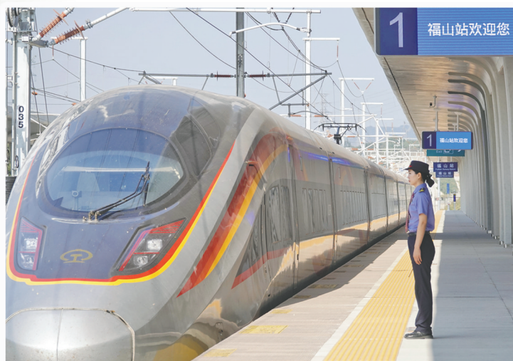
在潍烟高铁福山站，车站工作人员在站台接发列车。

冬日暖阳下，一组高速动车组列车风驰电掣般驶来，宛如一条白色“巨龙”，在山海间画出一抹壮丽的风景线。