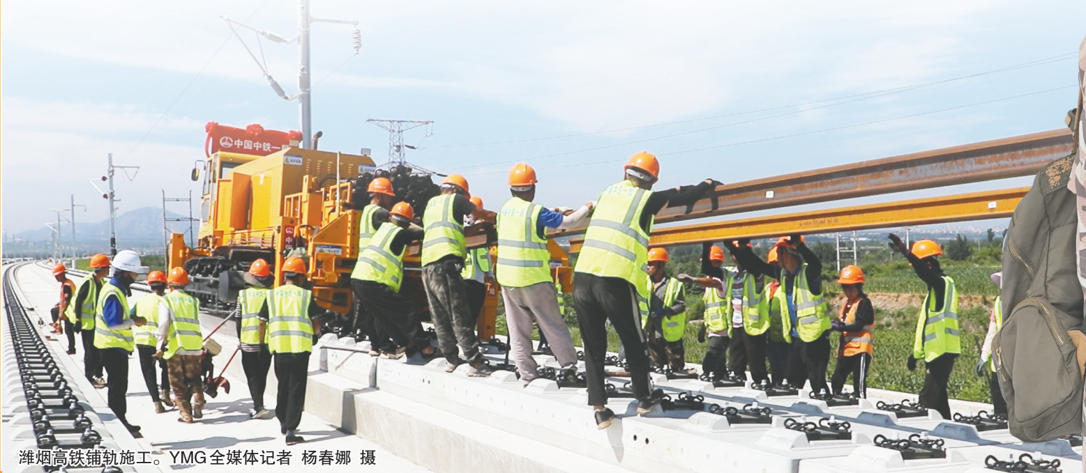
潍烟高铁铺轨施工。