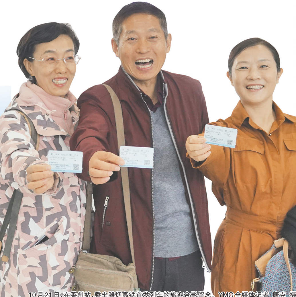
10月21日，在莱州站，乘坐潍烟高铁首发列车的旅客合影留念。