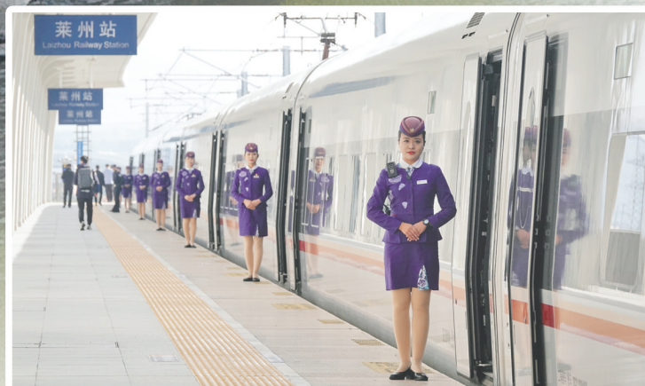
10月21日，在莱州站，潍烟高铁首发列车乘务员迎接旅客上车。