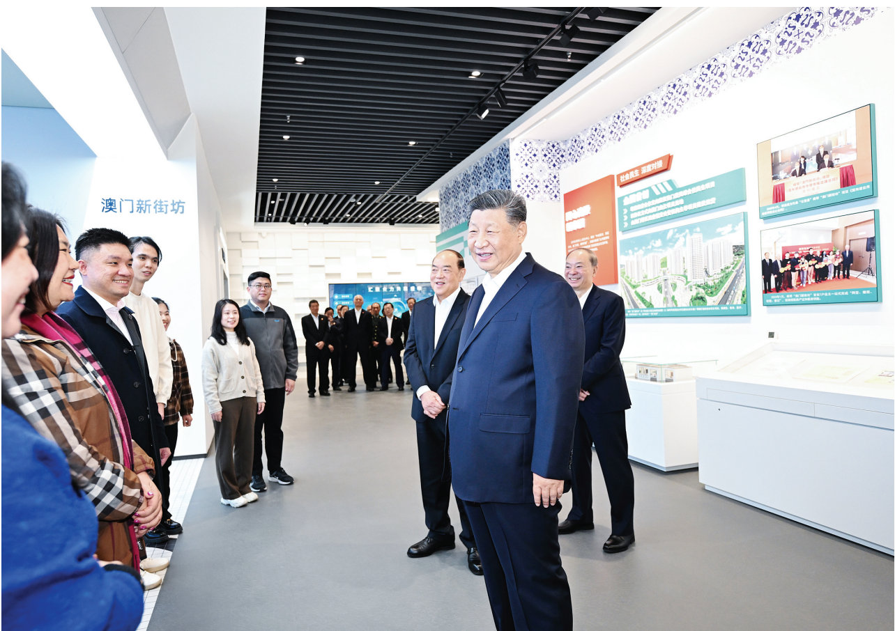
12月19日上午,中共中央总书记、国家主席、中央军委主席习近平在澳门特别行政区行政长官贺一诚陪同下,来到横琴粤澳深度合作区考察。这是习近平在横琴天沐琴台展示厅澳门新街坊项目展区前,同居住在这里的市代表亲切交谈。

新华社澳门12月19日电 19日上午,中共中央总书记、国家主席、中央军委主席习近平在澳门特别行政区行政长官贺一诚陪同下,来到横琴粤澳深度合作区考察。 横琴地处广东珠海南端,与澳门一水之隔,是促进澳门经济适度多元发展的重要平台。党的十八大以来,习近平总书记多次考察横琴,为横琴发展把舵定向。2021年9月,党中央、国务院发布《横琴粤澳深度合作区建设总体方案》,为合作区建设擘画美好蓝图。 在横琴天沐琴台展示厅,习近平参观“琴澳和鸣——横琴粤澳深度合作区建设主题展”。展厅里,一张张照片、一幅幅图表、一件件实物模型,生动直观展现了琴澳一体化发展情况和近年来粤澳深度合作阶段性成果,习近平不时驻足察看,询问有关情况。习近平表示,横琴粤澳深度合作区成立3年多来,各项工作取得了积极进展,琴澳一体化水平逐步提升,对澳门经济适度多元发展的支撑作用日益彰显。实践证明,中央决定开发横琴、建设合作区的决策是完全正确的。 习近平听取粤澳共建中医药高端