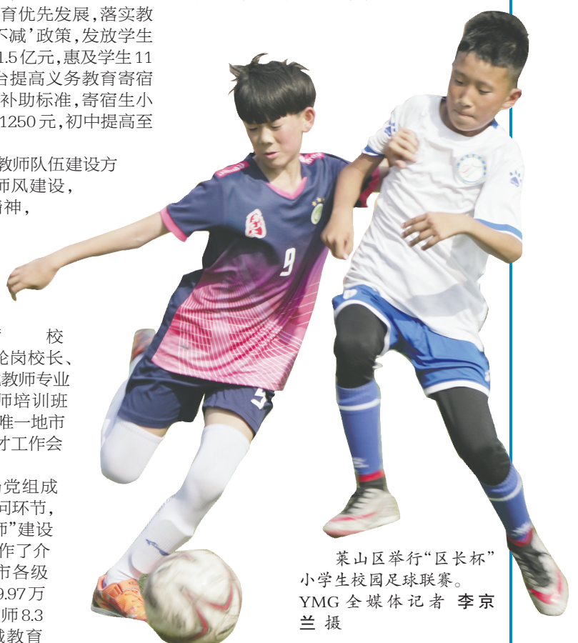
莱山区举行“区长杯”小学生校园足球联赛。

值得一提的是,烟台还发挥教育科研和教育信息化作用,强化教研支撑,常态化开展教学视导,全面提升教育教学水平。评选基础教育市级教学成果奖120项。持续推进国家级信息化教学实验区建设,入选首批全国中小学科学教育实验区。深化国家智慧教育平台应用,5个区市被确定为国家智慧教育平台市级示范区,41所学校被确定为示范校。110所学校被确定为国家级信息化教学实验区试点学校,35所学校被确定为教育大数据应用培育学校。