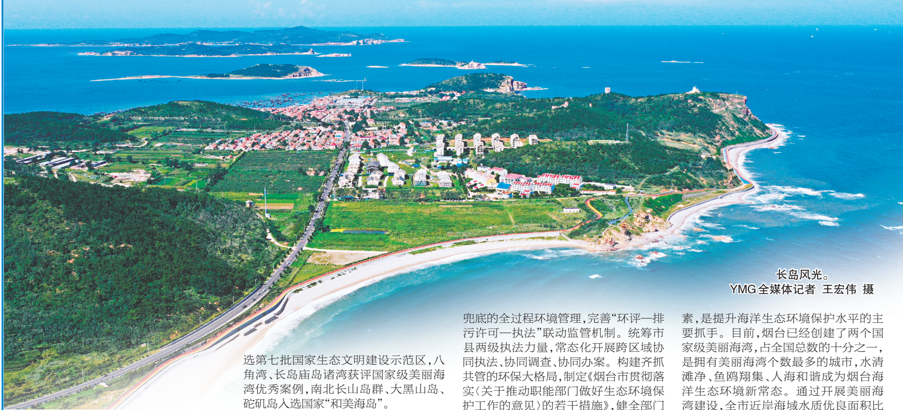
长岛风光。

选第七批国家生态文明建设示范区,八角湾、长岛庙岛诸湾获评国家级美丽海湾优秀案例,南北长山岛群、大黑山岛、砣矶岛入选国家“和美海岛”。