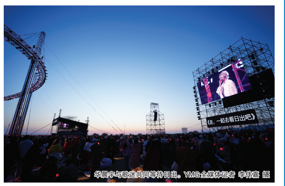
华晨宇与歌迷共同等待日出。

无论是神话传说，还是考古发现，都向我们印证了胶东半岛与“日出东方”的渊源。烟台在山东和胶东半岛的东端，是东方太阳升起较早的地方，不论“日出而作，日落而息”的旧时代生产方式，还是“朝沐黄海，落霞渤海”的新时代生活追求，都有着崇日指向和朝阳象征。上世纪六十年代，北京电影制片厂拍摄了大型舞蹈史诗《东方红》，开头的日出画面，便是取景于蓬莱的日宾楼。上世纪末，吴祖光所写的《长岛看日出》、刘白羽所写的《烟台山看日出》、分别列入中国100篇散文精粹和烟台2019年读书日必读书目。新世纪，烟台围绕日出开发了诸多旅游景区景点，也打造了打卡地和旅游场景。直到今年华展宇演唱会的日出，以“向阳而生”的演唱重启了烟台日出的按键，打出了“日出东方”的古老标签。各级政府的协作、文旅相关部门的协作，使这一优势资源得以重新挖掘，迎来了近年来少有的“泼天流量”。烟台的“寅宾出日”，历史底色鲜亮，现实传承迫切。我们也期待通过“寅宾出日”、向阳而生的探索，为仙境海岸、品重烟台研究开启一条路径，增添一抹亮色。