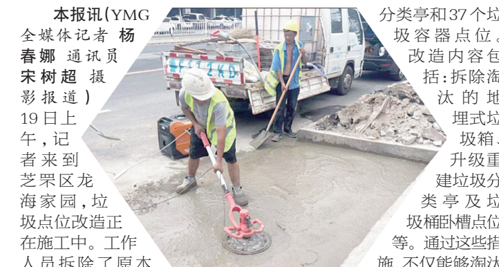
环卫工人正在对垃圾容器点位进行升级改造。

本报讯（YMG 全媒体记者 杨春娜 通讯员 宋树超 摄影报道）19 日上午，记者来到芝罘区龙海家园，垃圾点位改造正在施工中。工作人员拆除了原本的地理式垃圾箱，重建垃圾分类亭，配备污水排放管道等，让垃圾点位告别脏乱差，成为一道风景线。