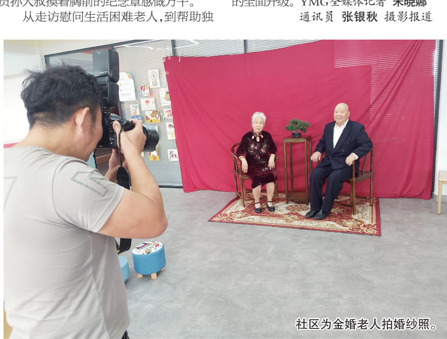
社区为金婚老人拍摄婚纱照。

幸福社区持续探索为老年群体提供更贴心的志愿服务，让“小老人”发挥余热，让“老老人”得到更好的照顾，实现“银龄家园”的全面升级。