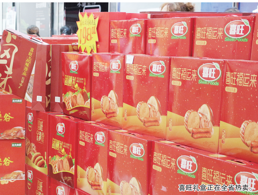
喜旺礼盒正在全省热卖。

礼盒产品风味独特，而且喜旺是大品牌、送礼有面子，成为“消费者最受欢迎的节日礼品”当之无愧。