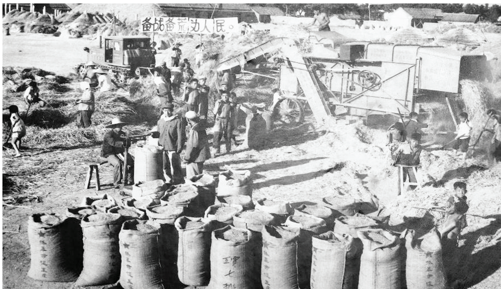
西由公社王贾村场院上的脱粒场景。

个车间,分别是机修车间、机械车间、气电焊车间、锻造车间、钳工车间(也叫革新组)、检测车间、木工车间。新上多台检修设备、1台高压油泵试验仪器、1台发动机转速数试验仪器、1台马力试验仪器。根据维修的需要,又增上了机床、钻床、刨床、铣床、镗床、汽电焊设备。同时,对外承揽加工业务,服务周边公社的农机用户,一举两得,也增加了营业收入。