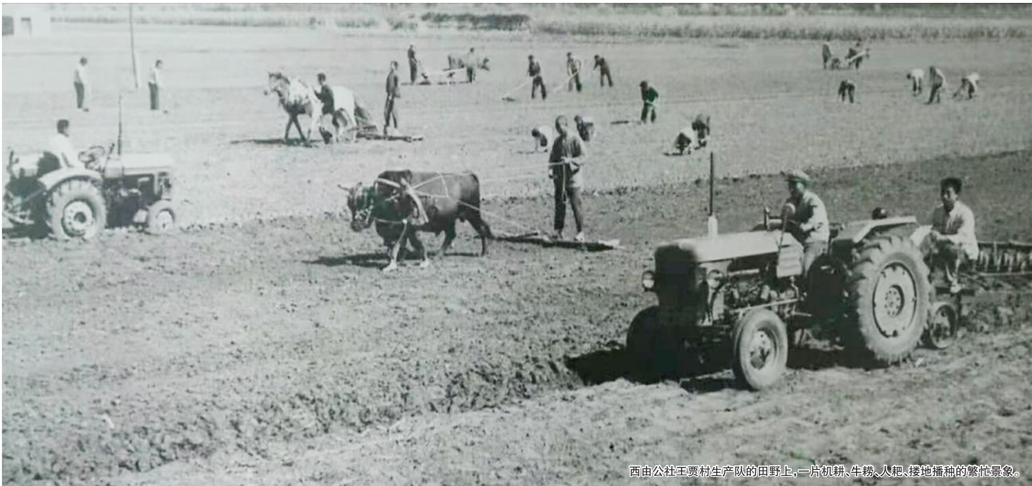
西由公社王贾村生产队的田野上,一片机耕、牛耕、人耙、接地播种的繁忙景象。

1958年8月,在西由这块古老而多情的土地上,诞生了山东省最早的掖县先锋人民公社(后更名为西由人民公社)。